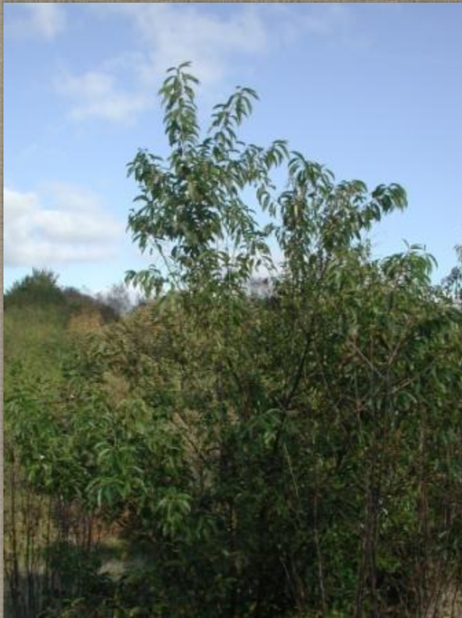
Overdrev med hæg