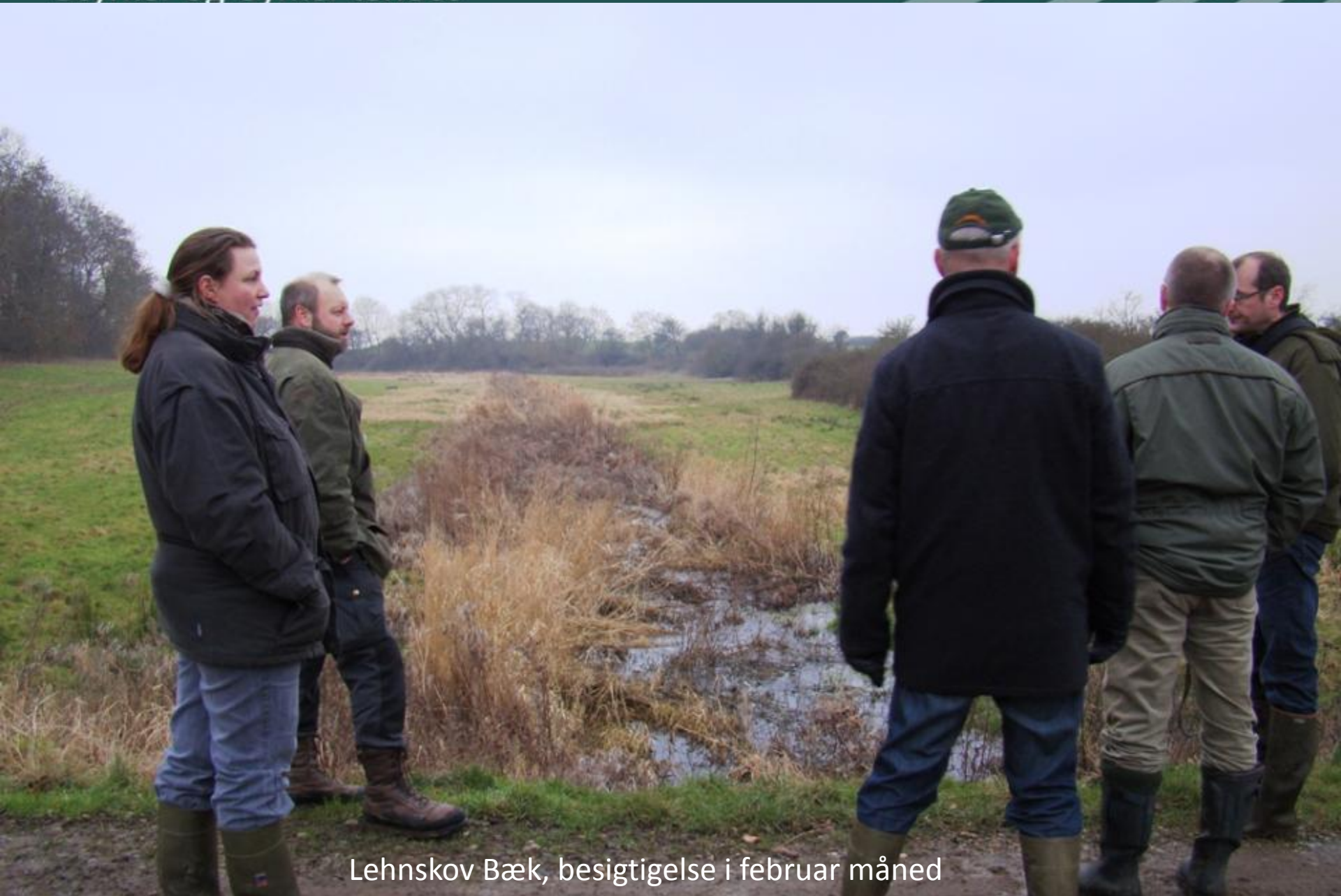
Lehnskov Bæk, besigtigelse i februar måned