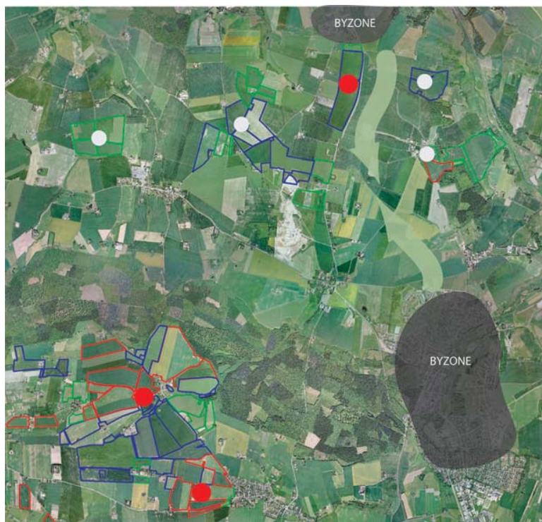
Et virksomhedslandbrug med 7 enkeltejendomme, hvor der er produktion på de 3 markeret med rødt.

rende bygninger og anlæg, der kan anvendes fremover, og hvilke bygninger og anlæg, der kan nedrives og fjernes. ■