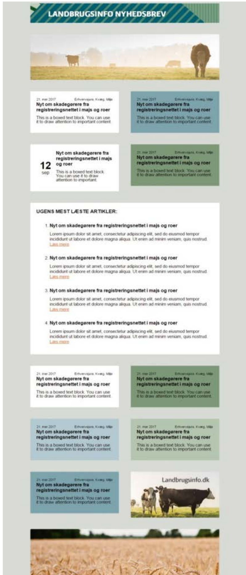
Billede 6: Eksempel på opsætning af mailskabelon

Ved at gøre brug af foruddefinerede områder, sikrer du en ensformighed i præsentation, der er til stor gavn, når man vil automatisere udsend, da det minimerer arbejdsressourcer betydeligt. Et automatiseret udsend kan med fordel benyttes, når du ønsker at sende personaliserede nyhedsbreve med næsten samme indhold og formål på samme tidspunkt hver uge/måned.