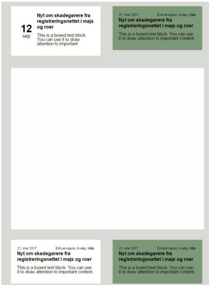
Billede 7: Eksempel på mailskabelon og placering af statisk og personaliseret indhold.