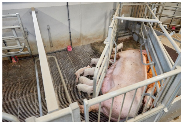
Figur 2: Placering af kop i kassesti og kombisti

Grisene i forsøgsgruppen havde mælk til rådighed i koppen fra kuldudjævning (dag et) og frem til fravænning. Mælkekopanlægget kørte tomt umiddelbart inden rengøring og opblanding af ny mælkeerstatning om morgenen. I diegivningsperioden blev der brugt to typer af mælkeerstatninger. En startblanding af mærket Pigipro 1 START (Schils, P.O. Box 435, 6130 AK Sittard, The Netherlands) og en smooth-blanding af mærket DanMilk B2B Complete (Agro Korn A/S, Skjernvej 42, DK-6920 Videbæk). Se indlægssedler i appendiks. Smooth-blanding benyttes som betegnelse for et mælkepulver, der benyttes til de ældste grise. Grisene gik fra startblanding til smooth ca. dag ti efter faring. Der blev skiftet blanding på sektionsniveau, og derfor vil grisene have varierende alder ved skift.